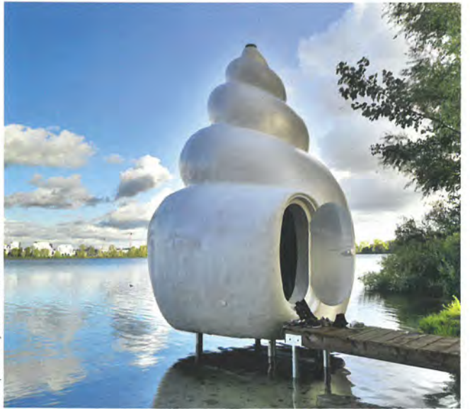
Conception Mrzyk & Moriceau.