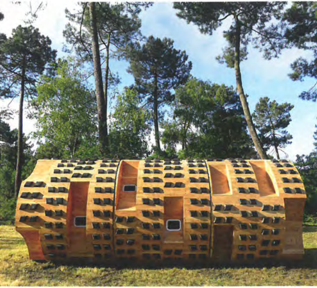
Conception Yuan Detraz. © Bruit du frigo / Zébra 3