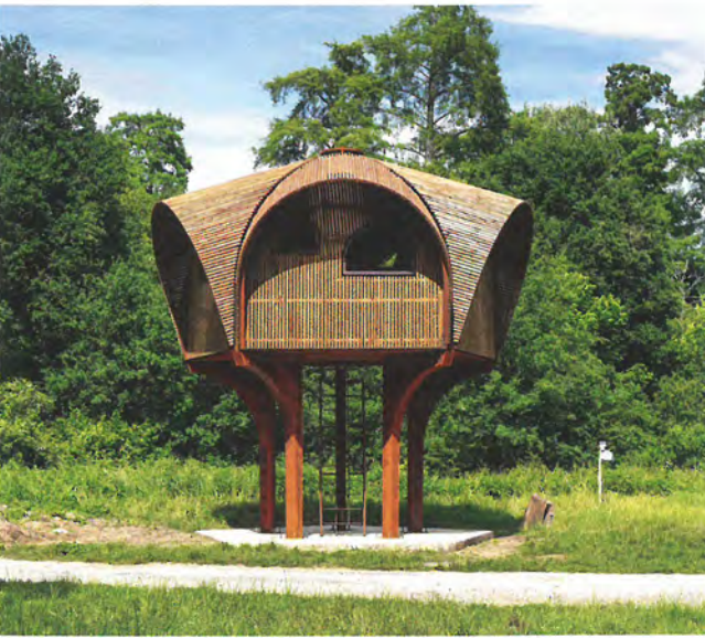
Conception Studio Weave. © Bruit du frigo / Zébra3