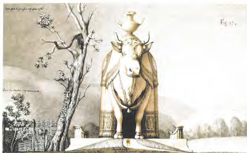
Dessin de Jean-Jacques Lequeu, L'étable à vache tournée au midi est sur la fraîche prairie, «architecture parlante» en forme de vache.