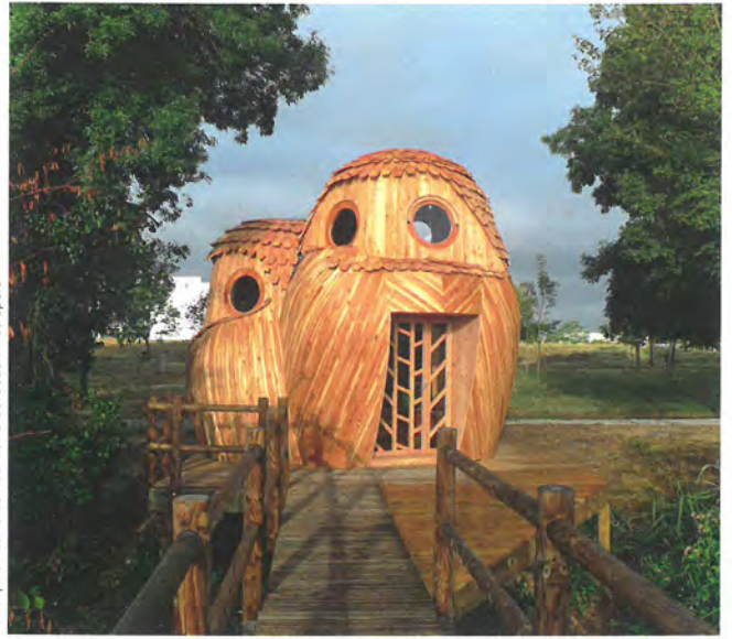
Conception Candice Pétrillo. © Bordeaux Métropole