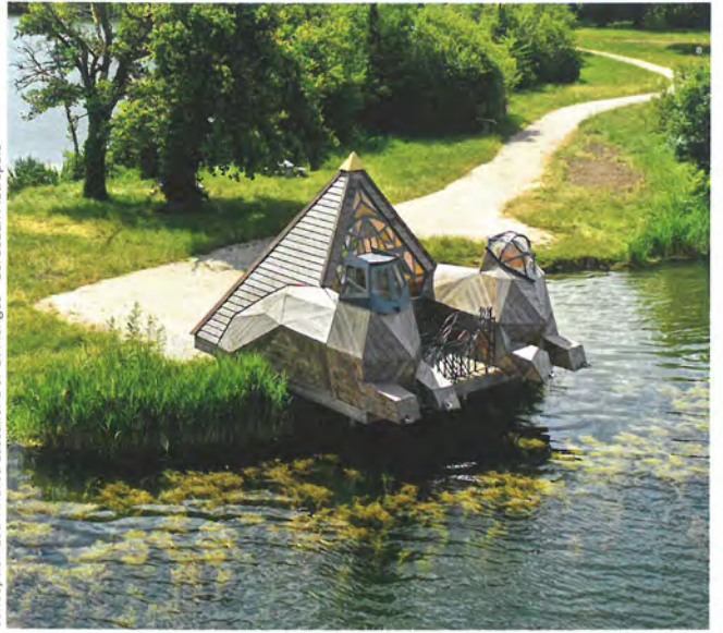
Conception Loui-Andréa Lassalle.