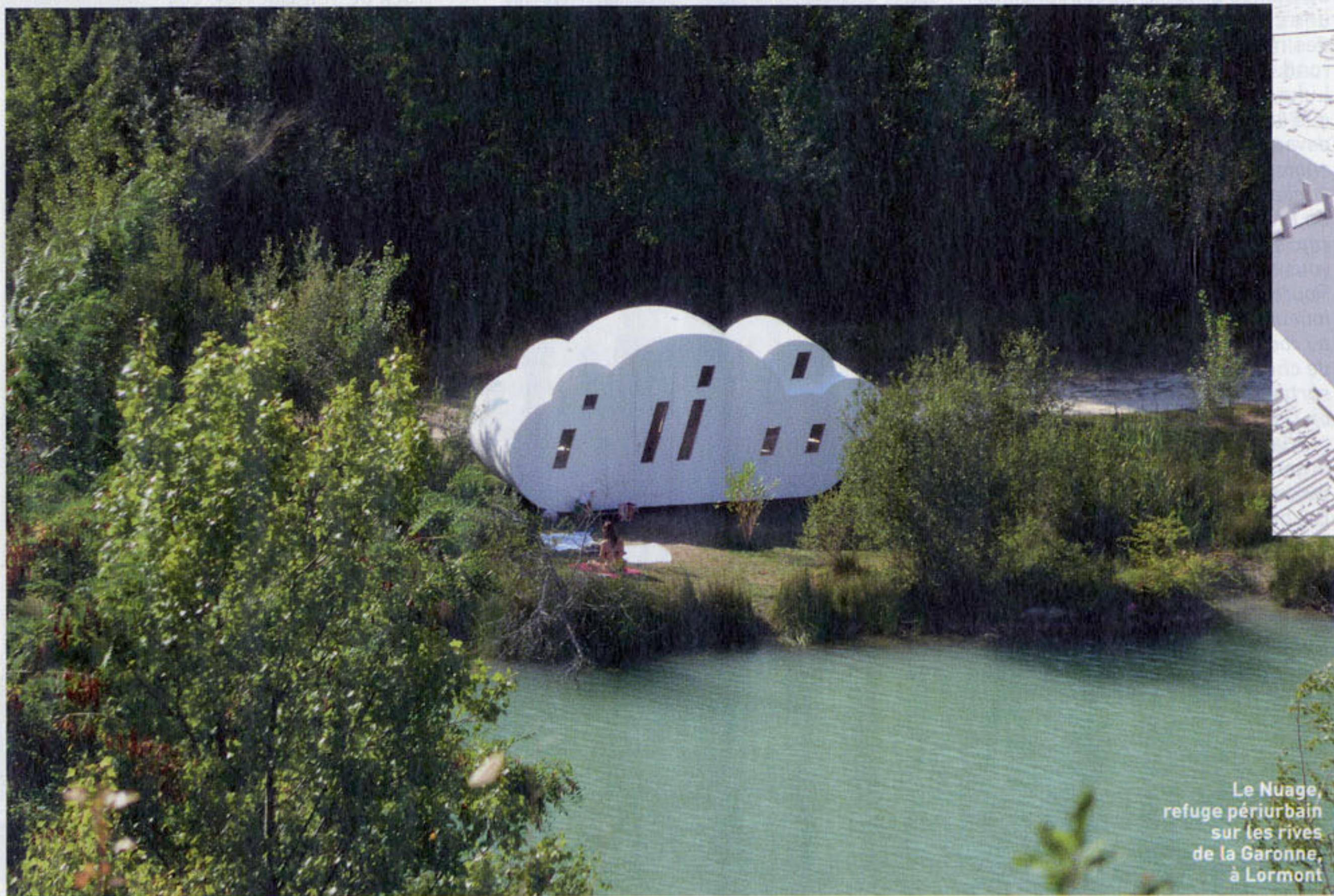
Le Nuage, refuge périurbain sur les rives de la Garonne, à Lormont