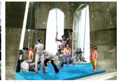
3 Balançoires et sol souple Tour St Michel