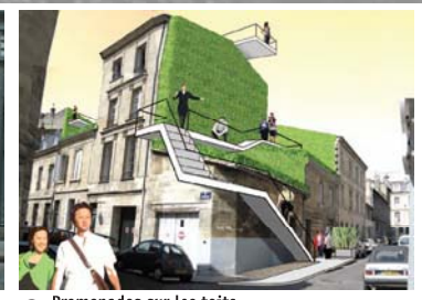
5 Promenades sur les toits Angle rue du Cloître et rue des Cordeliers