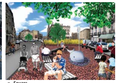
8 Square Place du Maucaillou