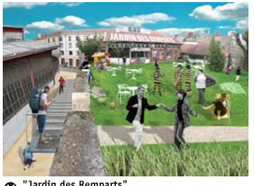
11 "Jardin des Remparts" Entre les rues du Hamel, des Douves et Marbotin