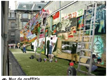
10 Mur de graffitis Rue Contrescarpe