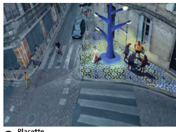
7 Placette Angle rue Bergeret et rue Leyteire