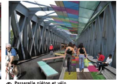
13 Passerelle piétonne et vélo "Pont Eiffel" SNCF

une association Bruit du frigo dans le cadre du projet PISSE MURAILLE 30 rue bouquière 33000 Bordeaux tel : 05 56 31 86 12 contact@bruitdufrigo.com