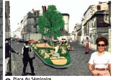
9 Place du Séminaire Angle rue du Hamel et rue Traversanne