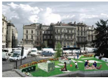
2 Jardins autour de l'église St Michel Rue des Faures et rue des Allamandiers