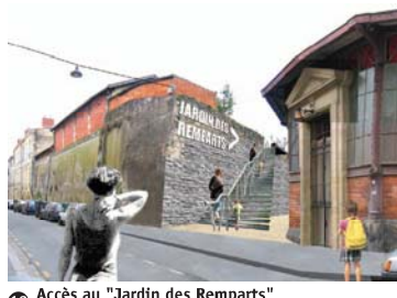
12 Accès au "Jardin des Remparts" Rue Marbotin