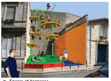
6 Square et terrasses 18 rue du Cloître