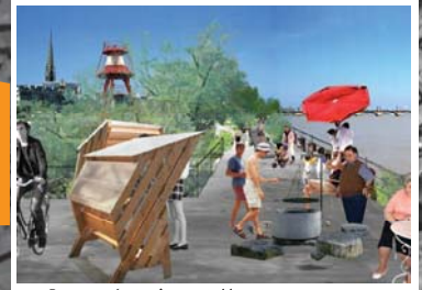
1 Parcours botanique et détente Quais de la Monnaie